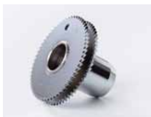
〈製品事例〉産業用装置部品