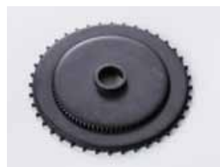
〈製品事例〉産業用装置部品

〈製品事例〉 工業用マシン部品 工業用マシンは高速縫製であり、作業性や品質安定を求められています。そのマシンの心臓部と言われる「針落ち部」、「布押え部」のパーツとして使用されています。