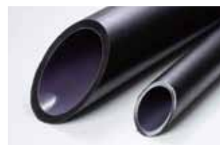
〈成形事例〉多層押出成形