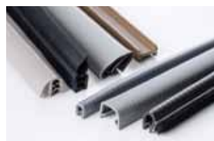
〈成形事例〉押出成形品

硬質・軟質の両押出成形、更に金属加工技術と融合した金属インサート押出成形が対応可能。