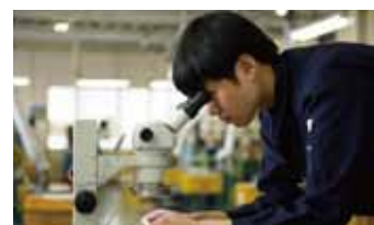
技術的難易度の高いばね成形にも積極的に対応