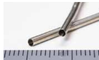
製品名 平板密着ばね 材質 SUS304WPB サイズ 線径0.1mm×0.2mm 等 用途 ガイドワイヤー(医療器具)