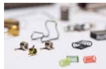
各種表面処理・二次加工に対応