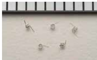
製品名 コイル 材質 プラチナ線 サイズ 線径30μm 用途 センサー素子