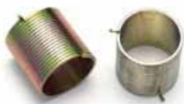
製品名 角線クラッチばね 材質 SWP サイズ 線径1.4mm角 用途 クラッチ

形状や線幅の特殊材料などの試作、材料メーカーとの連携による開発や他社が困難とする精密ばねの成形にも挑戦しています。