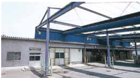
柏公設市場冷凍倉庫(温度管理:-40~0℃ 2,000t)