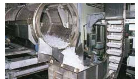
砕氷選別装置・自動計量・給袋包装装置