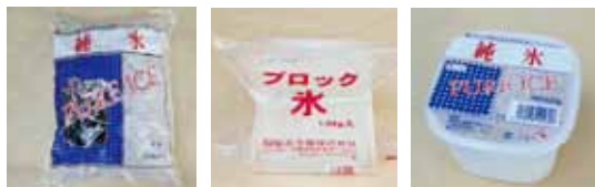
ロックアイス ブロック氷 ロックアイス(カップ)